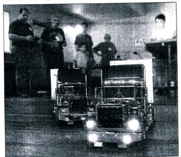
Beau comme un camion !